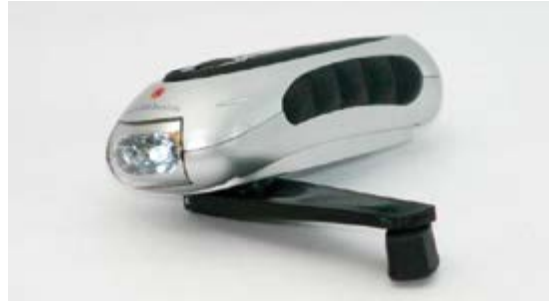
Eine Taschenlampe mit Handkurbel kann bei Stromausfall hilfreich sein.